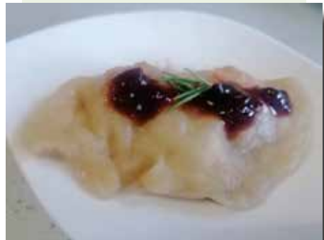
Gyoza CLB en salsa de soja i cirera