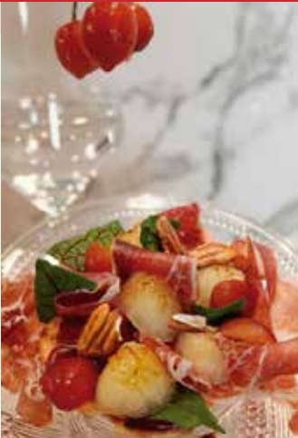
Pa amb cireres, pernil ibèric, meló i anous