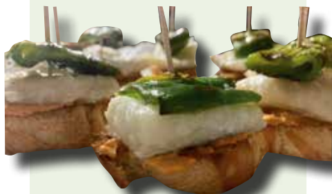
Ventresca d'abadejo amb un toc de romesco de cirera