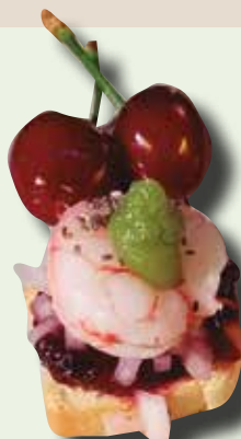
Torrada de ceviche de cireres